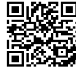
スマートフォン・タブレット用 QR コード

獨協医科大学図書館トップページ「データベース・ツール」>テキスト・辞書・動画の eBook Library のリンクを選択、またはスマートフォン・タブレット用 QR コードから利用してください。